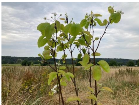
nashipeer 2e bloei

Een bijzondere ervaring had ik met de nashi peer. Op een warme dag, de dag